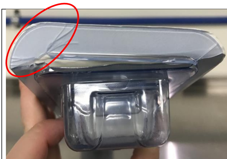
Sl. 1. Polomljeni rub vanjske ambalaže

Jako je vjerojatno kako bi svako oštećenje kartonske kutije i/ili vanjske ambalaže bilo primijećeno prije operacije. Prilog pakiranju (upute za upotrebu) isporučen s proizvodom ili sistemom proizvoda sadrži odjeljak o sterilnosti. On korisniku nalaže da pregleda ambalažu i proizvod ne primjenjuje ako je bilo koja barijera ili šupljina oštećena.