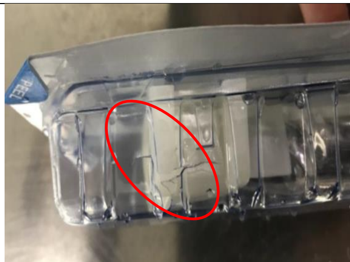
Sl. 2. Napukline na unutarnjoj ambalaži blizu čepa