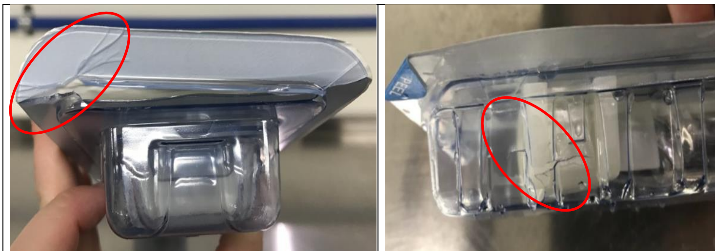
Sl. 1. Polomljeni rub vanjske ambalaže

Jako je vjerojatno kako bi svako oštećenje kartonske kutije i/ili vanjske ambalaže bilo primijećeno prije operacije. Prilog pakiranju (upute za upotrebu) isporučen s proizvodom ili sistemom proizvoda sadrži odjeljak o sterilnosti. On korisniku nalaže da pregleda ambalažu i proizvod ne primjenjuje ako je bilo koja barijera ili šupljina oštećena.