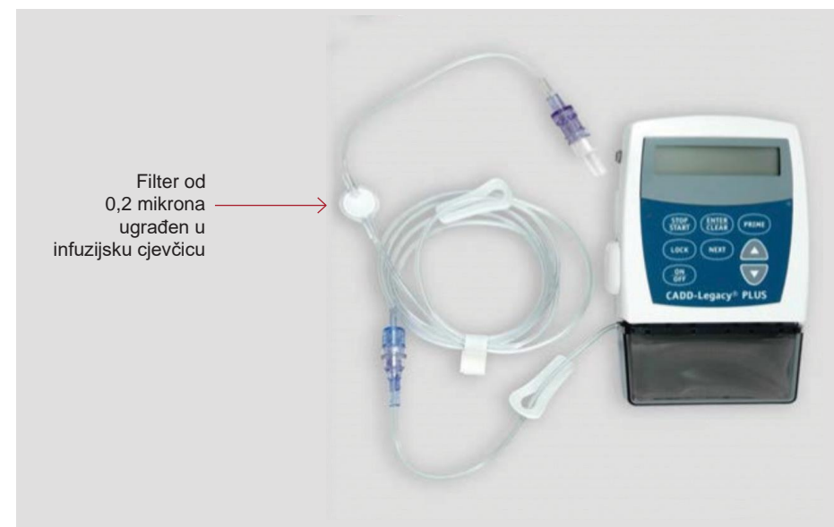
Filter od 0,2 mikrona ugrađen u infuzijsku cjevčicu

Neke cijevi sadrže filter koji pomaže odstraniti sve bakterije koje uđu u sustav. Ako Vaša cijev već ne sadrži filter, u Vaš sustav između pumpe i zatvorenog sustava pripoja treba staviti filter od 0,2 mikrona ugrađen u infuzijsku cjevčicu. On se mijenja svakodnevno (svaka 24 sata) istovremeno s infuzijskim cijevima i spremnikom za lijek.