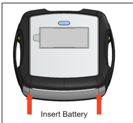
Slika 1: Umetanje baterije