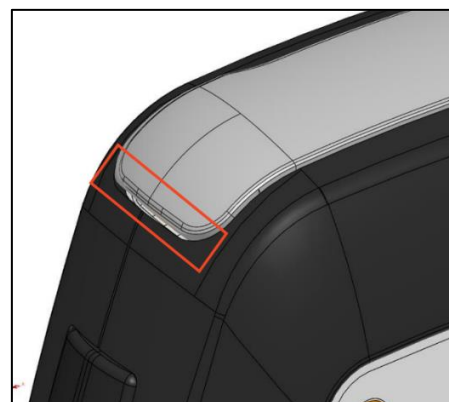
Slika 2: Kućište baterije