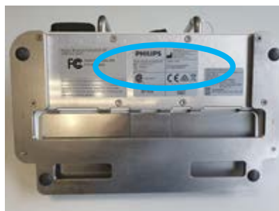
Slika 1: mjesto oznake pri dnu nožnog prekidača