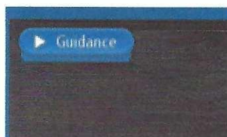
Slika 2 Oznaka Guidance View (Prikaz navođenja) na kvadrantu izgleda zaslona