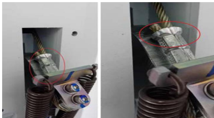
Slika 1 Naborani priključak metalnog kabela

Do travnja 2024. tvrtka Philips nije primila nijedno izvješće o tom problemu ili ozljedi.