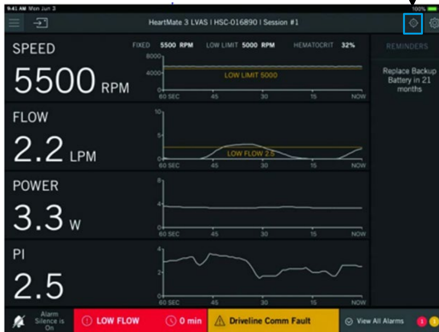
Slika 1: Zaslona komunikacijskog sustava HeartMate Touch