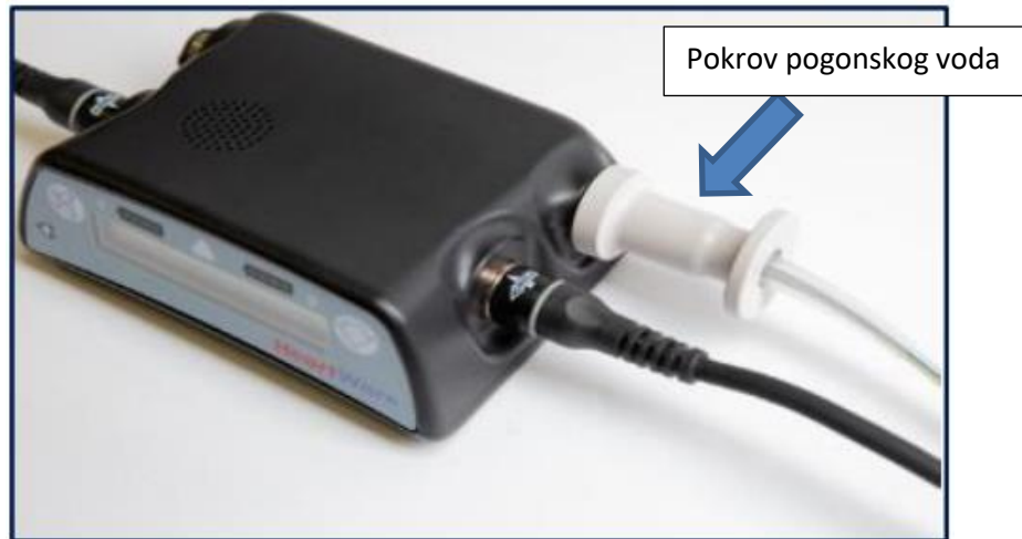
Slika 1: Kontroler s pokrovom pogonskog voda postavljenim preko priključka pogonskog voda