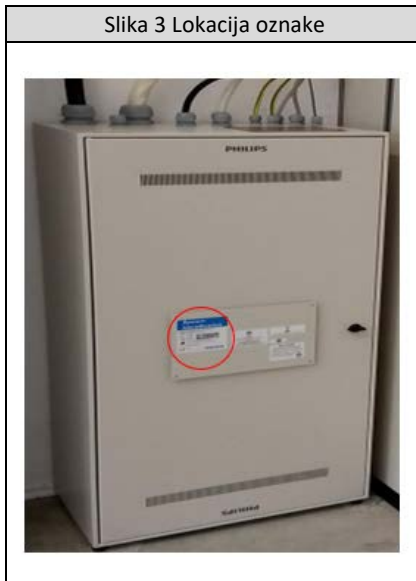
Slika 3 Lokacija oznake