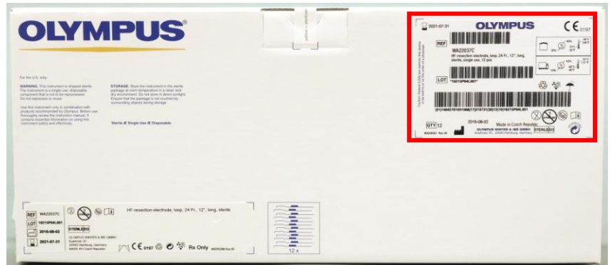
Slike 1, 2 i 3: vanjska ambalaža elektroda