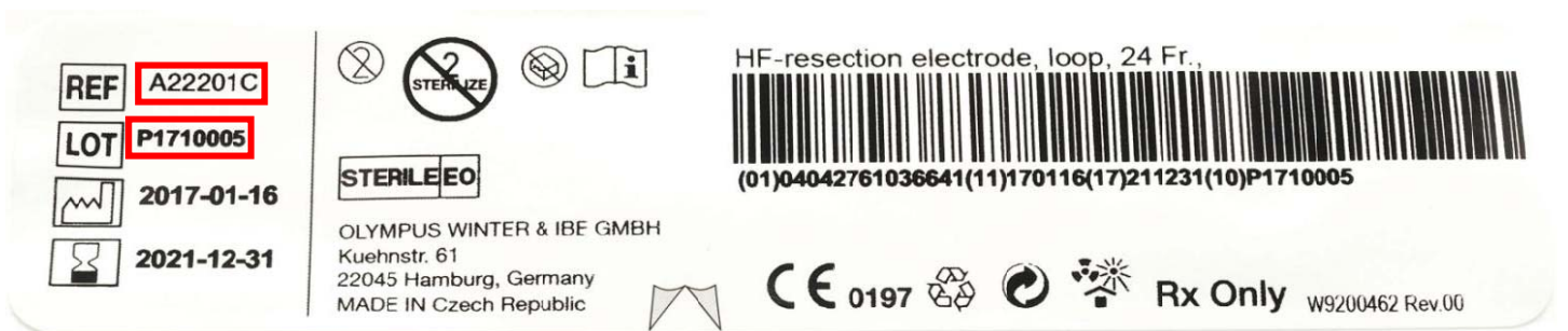
Slika 7: broj modela (REF) i broj serije (LOT) na oznaci na blister pakiranju