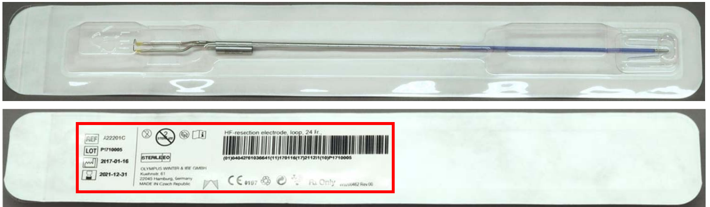
Slike 5 i 6: blister pakiranje elektroda