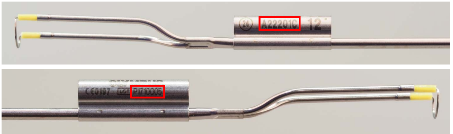
Slike 8 i 9: broj modela i broj serije (LOT) na elektrodi