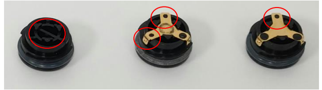
Oštećeni poklopci baterije - nemojte koristiti! Metalni kontakt nedostaje ili su manje od 3 točke odignute

Ako pumpa prestane s isporukom inzulina zbog gubitka napajanja, to može dovesti do različitih stupnjeva visokog šećera u krvi, uključujući dijabetičku ketoacidozu (DKA). Prijavljene su ozbiljne povrede povezane s inzulinskim pumpama MiniMed™ serije 600 i MiniMed™ serije 700 povezane s oštećenim poklopcima, ali pregled neovisnih kliničkih stručnjaka je pokazao da nisu sve izravno povezane s ovim problemom. Oštećeni kontakti baterijskog poklopca mogu dovesti do prethodno opisanih događaja.